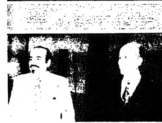
وقال الرئيس في الحديث الصلح : ان هذا الاجتماع تميز بوجوه الاخوة الوحدة الوطنية بين اللبنانيين ، وواجاد الحصول لعدد من القضايا الجوهرية المهمة ، ولتأكيد الاستمرار في التعاون الاخوي لما فيه خير الجميع .